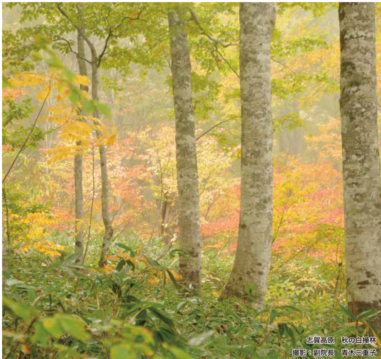
志賀高原 秋の白樺林