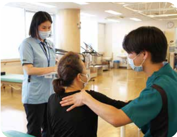
退院支援、リハビリ見学対応の様子

病名、病状、発病・受傷時期に応じて、申請できる制度や時期が異なります。申請が可能かどうか患者さまの状況を確認しながら、必要な書類などをご案内します。