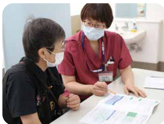
入退院支援窓口 案内の様子

入院生活での不安や質問などに対し、入院前の説明面談の際にご相談をお受けし、入院からその後の療養生活を快適に過ごせるよう親身になって支援します。