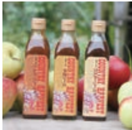
高橋ソース 株式会社 埼玉県本庄市下野堂604-7 TEL 0495-24-1641 お問い合わせ時間/9:00~17:00 定休日/土・日・祝 http://www.takahashisauce.com