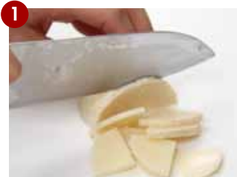
たけのこをいちよう切りに。