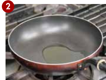
軽く熱したフライパンにオリーブ油を敷く。