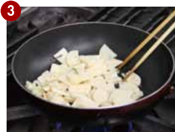
たけのこを入れ、軽く炒める。