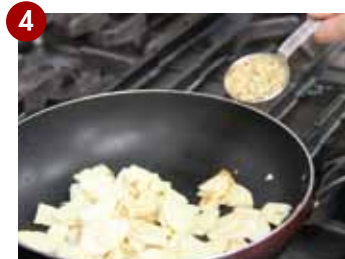
粒マスタード、塩を入れてさらに炒める。

はじめまして!! 栄養士のこのちゃんです。 これから当院で提供している 栄養科レシピをたくさん 紹介していきます。 よろしくお願ひします。