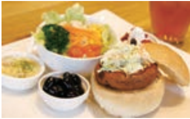
がんもバーガーセット

ベーカリー&カフェ クローンヌナチュール COURONNE NATURE 埼玉県児玉郡上里町七本木2272-1 TEL 0495-71-9758 営業時間/7:00~20:00 定休日/火