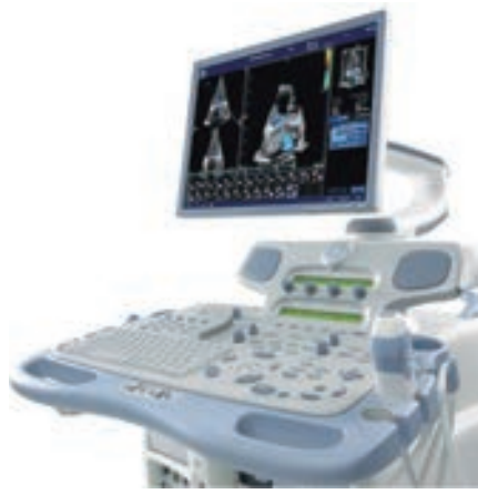
超音波検査 (GE Vivid 7 Dimension)

大きさ、壁の厚さ、弁膜の動き、血液の流れなどさまざまな心機能を調べます。心臓のほか、腹部（肝臓、胆のう、すい臓、ひ臓、腎臓など）、甲状腺、頸動脈、四肢動脈など、全身のさまざまな臓器を診ることができま