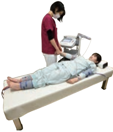
血圧脈波検査 (オムロンコリン BP-203RPEⅢ)