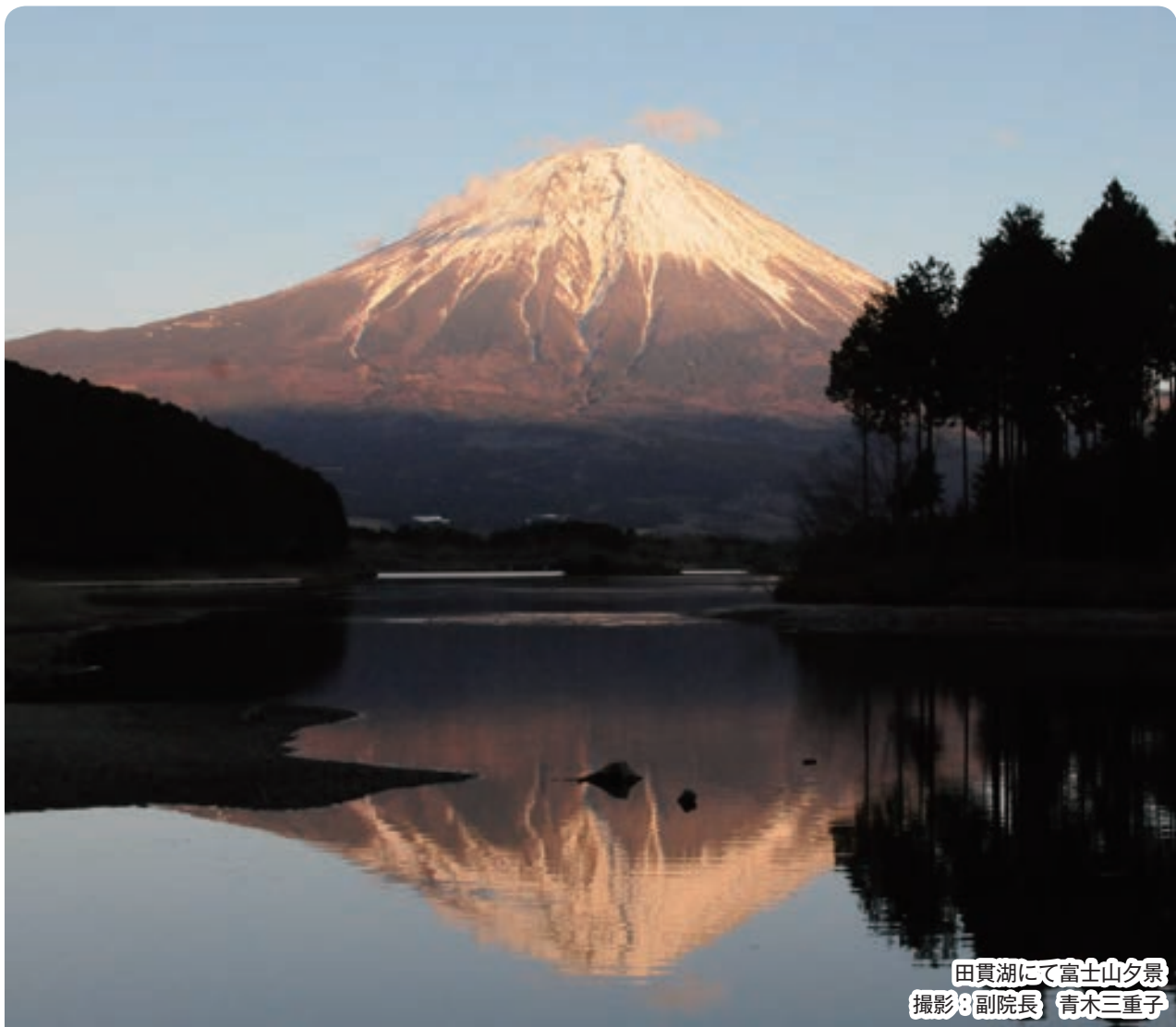
田貫湖にて富士山夕景